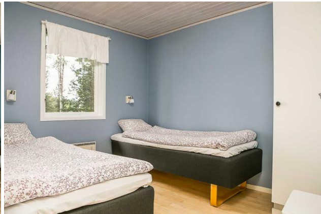
Sovrum i stuga, Uskavigården

Under söndagen blir det mera körning och färre besök. Vi börjar norrut och byter kurs i Kopparberg. Dagens fika intas i Västanfors, just utanför Fagersta. Vi samlar lite kulturpoäng när vi kollar in Sveriges första masugn som anlades på medeltiden. Lunch äter vi i trakten av Avesta innan vi på mindre vägar i Västmanland och Uppland rör oss hemåt. Turen avslutas vid E4 i Upplands-Väsby, där vi planerar att vara vid 16.30-tiden.