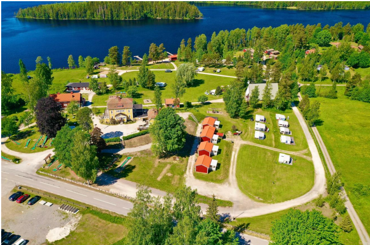
Uskavigården (våra stugor ligger i bildens högra övre del)