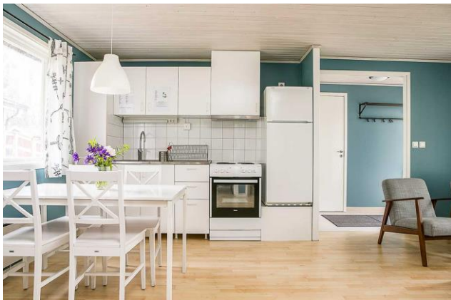
Kök i stuga, Uskavigården